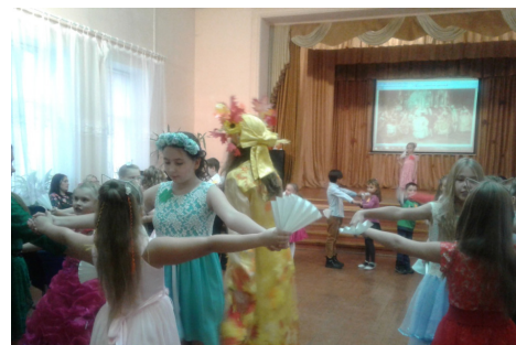
Закончился праздник традиционно - выбором Короля и Королевы.