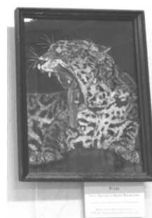
Рис. 2. Этикетка на работе, которая размещается на вертикальной поверхности (например, на стене)