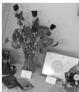
Рис. 1. Этикетки у работ, установленных на горизонтальной поверхности